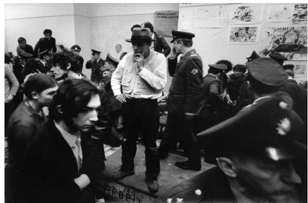
Abb.: Joseph Beuys während der Räumung des Sekretariats der Staatlichen Kunstakademie in Düsseldorf, 1972.