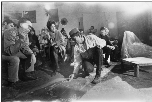
Joseph Beuys mit Studenten im Ringgespräch, Staatliche Kunstakademie Düsseldorf, 1967 (links: J. Stüttgen).